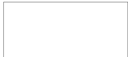
ПРЯМАЯ ЧАСТЬ #

ЗАКАЗЧИК _____ ОБЪЕКТ _____ АДРЕС _____ СРОК ПОСТАВКИ _____